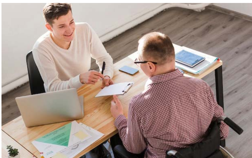
Una persona hace el procedimiento para valorar su discapacidad.

La discapacidad se valora con preguntas y documentos médicos.