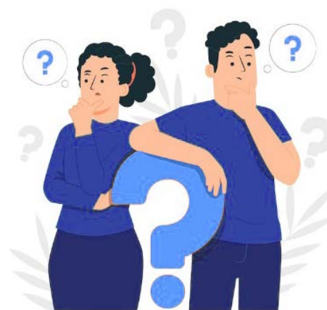
Dibujo de 2 personas que piensan posibles preguntas.