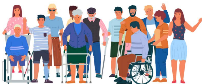
Varias personas con distintos tipos de discapacidad.

Las Administraciones Públicas clasifican las discapacidades según cómo afectan a la vida de las personas. Las ordenan en grados de discapacidad que se expresan en un porcentaje, es decir, un número entre el 0 y el 100