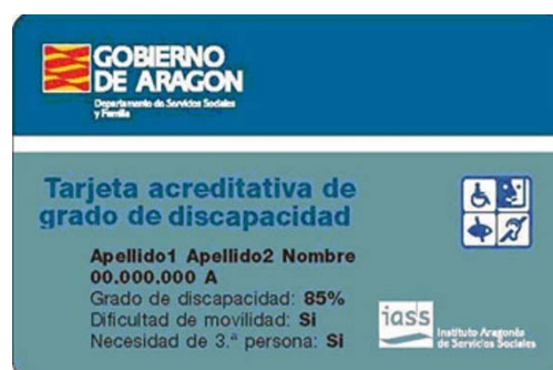
Tarjeta de discapacidad de la Comunidad Autónoma de Aragón.

En otras, debes pedirla tú mismo o tú misma después de recibir los resultados.