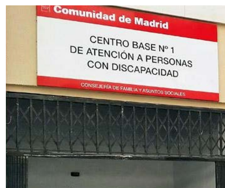
La fachada de un Centro Base de Valoración y Orientación a personas con discapacidad en la Comunidad de Madrid.

Por ejemplo, en la Comunidad de Madrid se llaman Centros Base de Valoración y Orientación a personas con discapacidad.