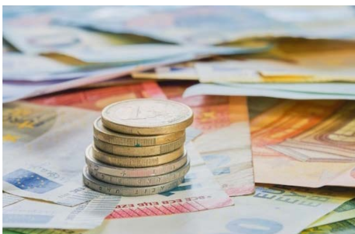
Monedas y billetes de euro.

Procedimiento de valoración de la discapacidad: es el trámite por el que las administraciones estudian la situación de una persona con discapacidad, para saber cuánto le afecta en su día a día.